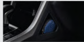
Instrument Panel Side Pocket