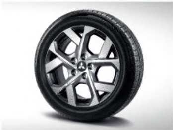
NEW 17Inch Alloy Wheel Design