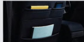
Multifunction Seat Back Pocket (Driver + Passenger)