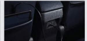
2 nd Row USB Port*