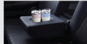
2 nd Row Armrest with Cup Holder