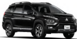
Jet Black Mica