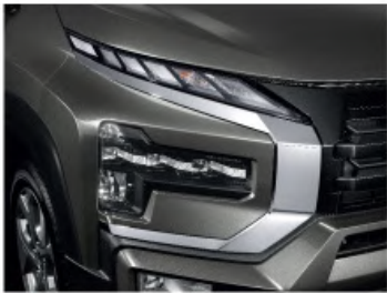
NEW T-Shape Headlamp

The New Xpander Cross hadir dengan tampilan lebih kokoh dan interior yang nyaman serta dilengkapi fitur baru yang canggih untuk bangkitkan petualangan seru dalam hidup Anda.