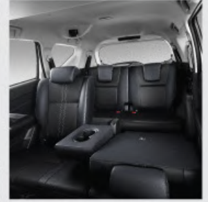
Spacious Third Row Seats