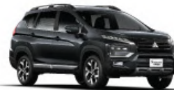
Graphite Gray Metallic