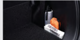
Rear Luggage Compartment