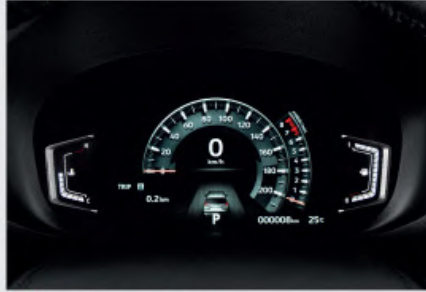
NEW 8inch LCD Meter Cluster