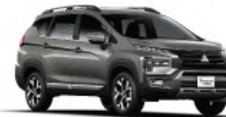
Green Bronze Metallic