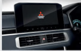
9inch Audio Head Unit with Smartphone Connectivity