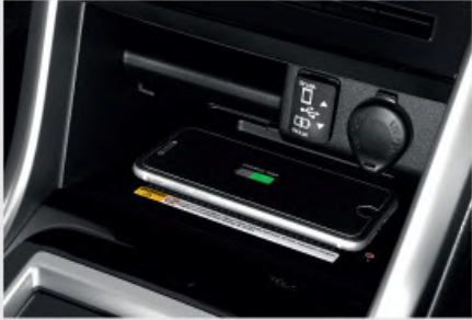
NEW Wireless Charger