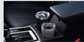
Front Cup Holder*