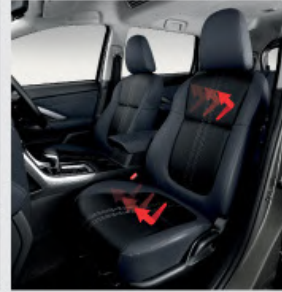
Dual Tone Synthetic Leather Seat with Heat Guard*