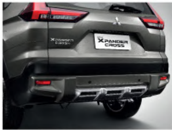
NEW Rear Powerful Bumper Design