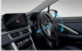
Tilt & Telescopic Steering