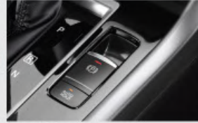
Electric Parking Brake with Brake Auto Hold*