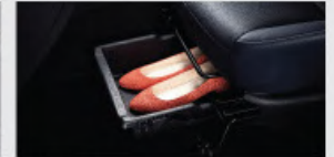
Seat Under Tray