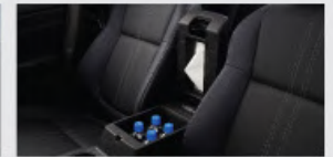
Closed Storage Box*