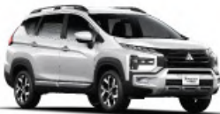
Quartz White Pearl