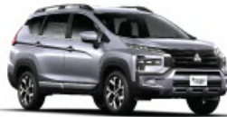
Blade Silver Metallic