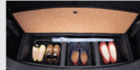
Underfloor Luggage Area Storage