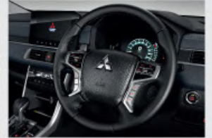
NEW Steering Wheel Design